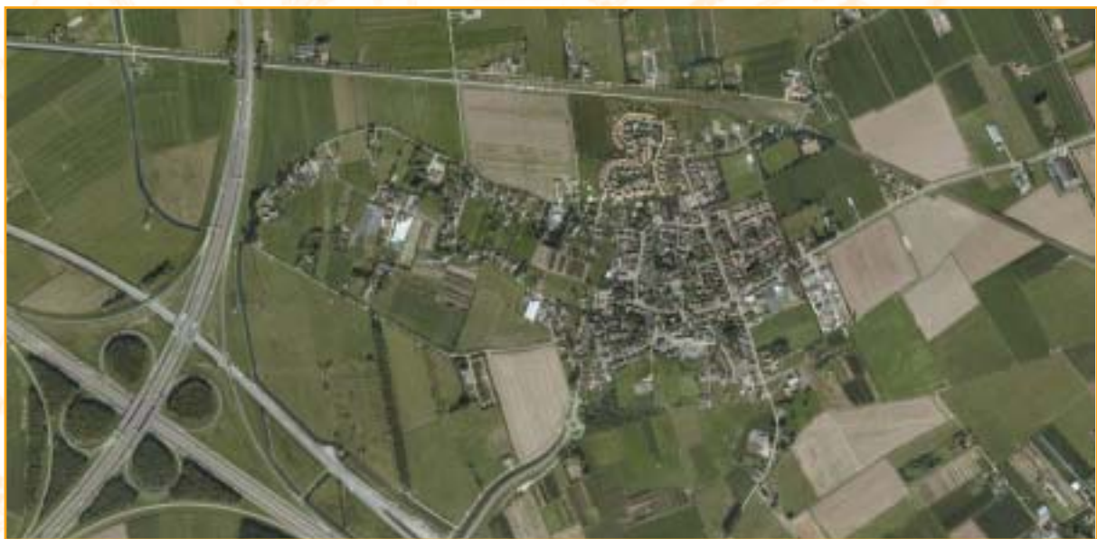
Valburg in 2007