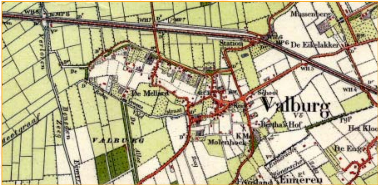
Valburg in 1903