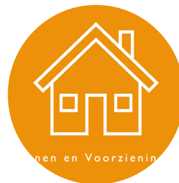
Wonen en Voorzieningen