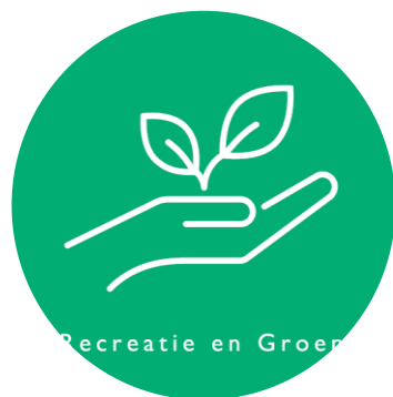
Recreatie en Groen