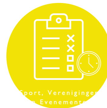
Sport, Verenigingen en Evenementen