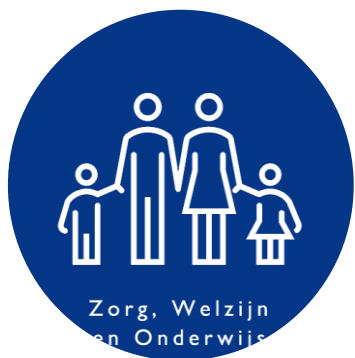
Zorg, Welzijn en Onderwijs